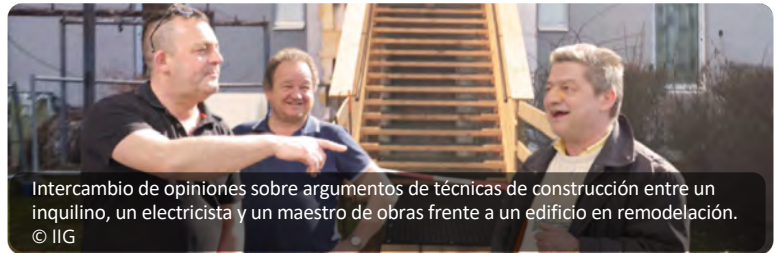
Intercambio de opiniones sobre argumentos de técnicas de construcción entre un inquilino, un electricista y un maestro de obras frente a un edificio en remodelación.